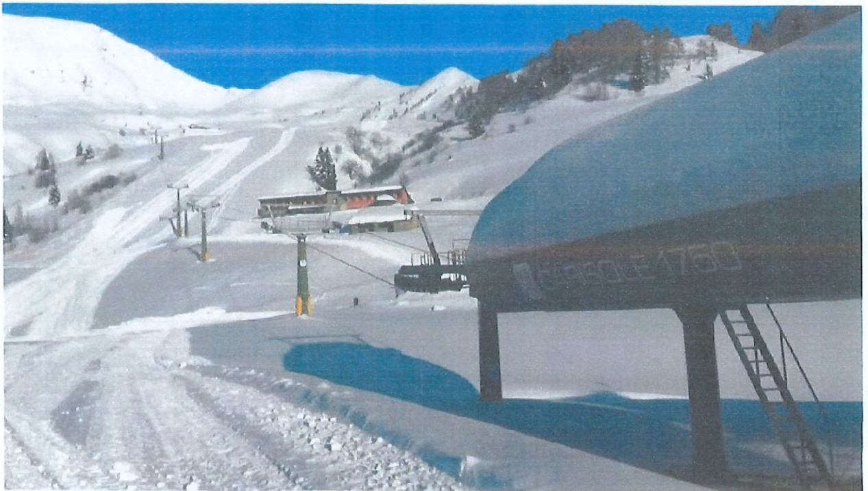
SEGGIOVIA CONCA NEVOSA