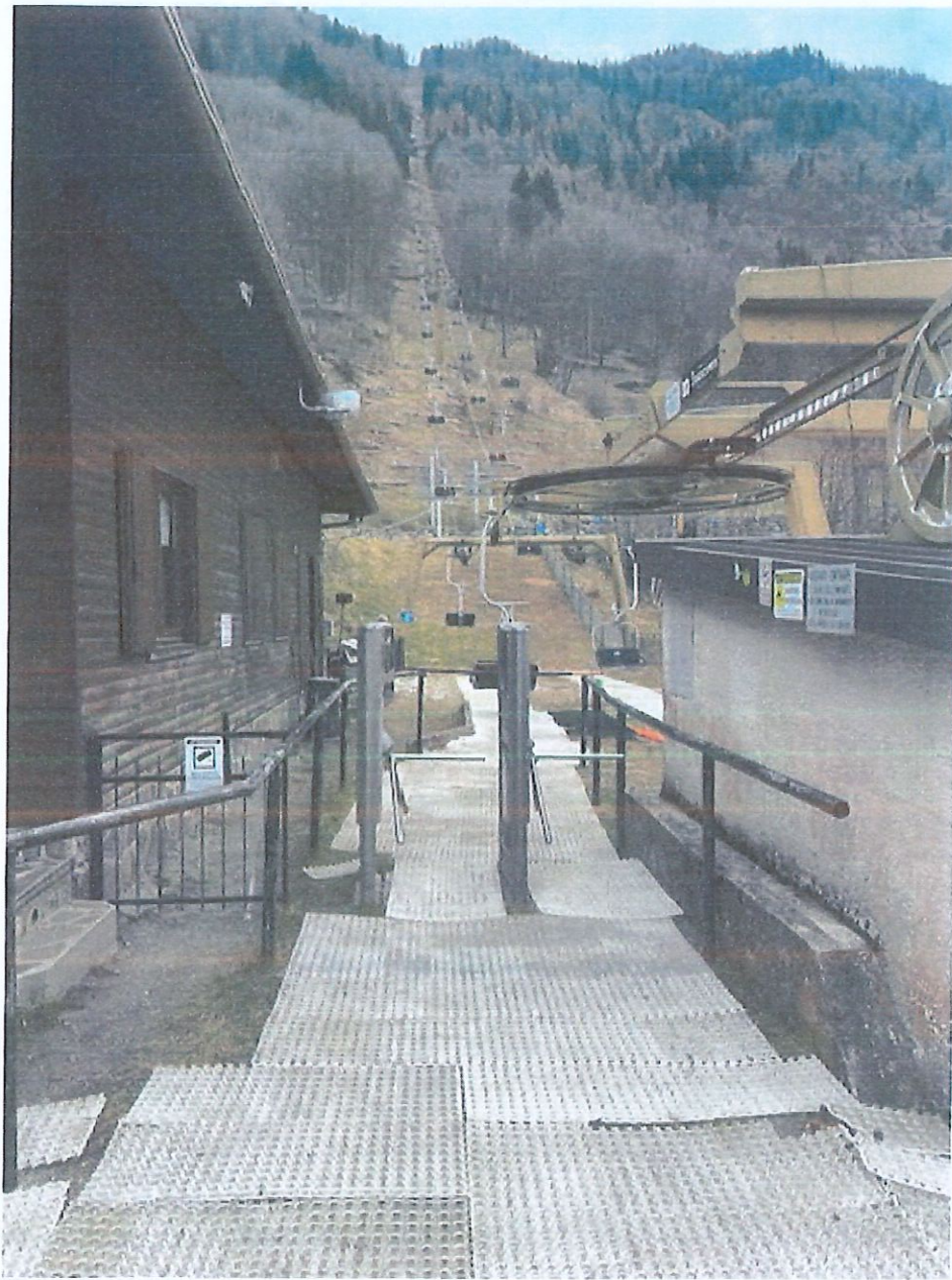
SEGGIOVIA ALPE SOLIVA