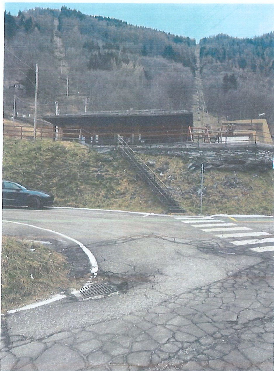
SEGGIOVIA ALPE SOLIVA

In riferimento alle caratteristiche dei locali, degli impianti, delle attrezzature sopra descritte, nonché dell'installazione ed elementi di arredo ivi presenti, gli Operatori Economici Promotori dovranno dichiarare espressamente, a seguito del sopralluogo di cui al successivo art.10, di averne constatata la consistenza e di averne verificato lo stato di funzionamento e di conservazione tecnico ed amministrativo, con la sottoscrizione di apposito verbale di consegna redatto in contraddittorio tra le parti.